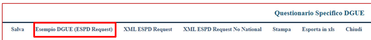
Figura 7 – Esempio Modulo DGUE

Utilizzando la funzione “ Esempio Modulo DGUE ” per il RUP può controllare i dati la cui compilazione è a cura dell’Ente Appaltante (campi editabili) e scorrere l’elenco dei campi che invece dovrà compilare l’Operatore Economico: