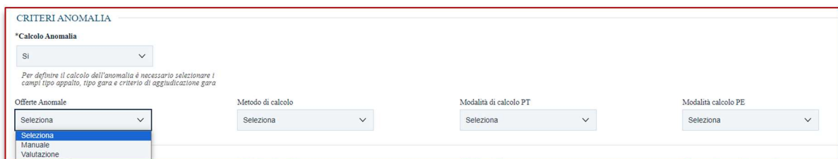
Figura 10 - Scelta modalità offerte anomale

2) Nelle altre modalità l'opzione Offerte Anomale prevederà la possibilità di scegliere tra Manuale o Valutazione .